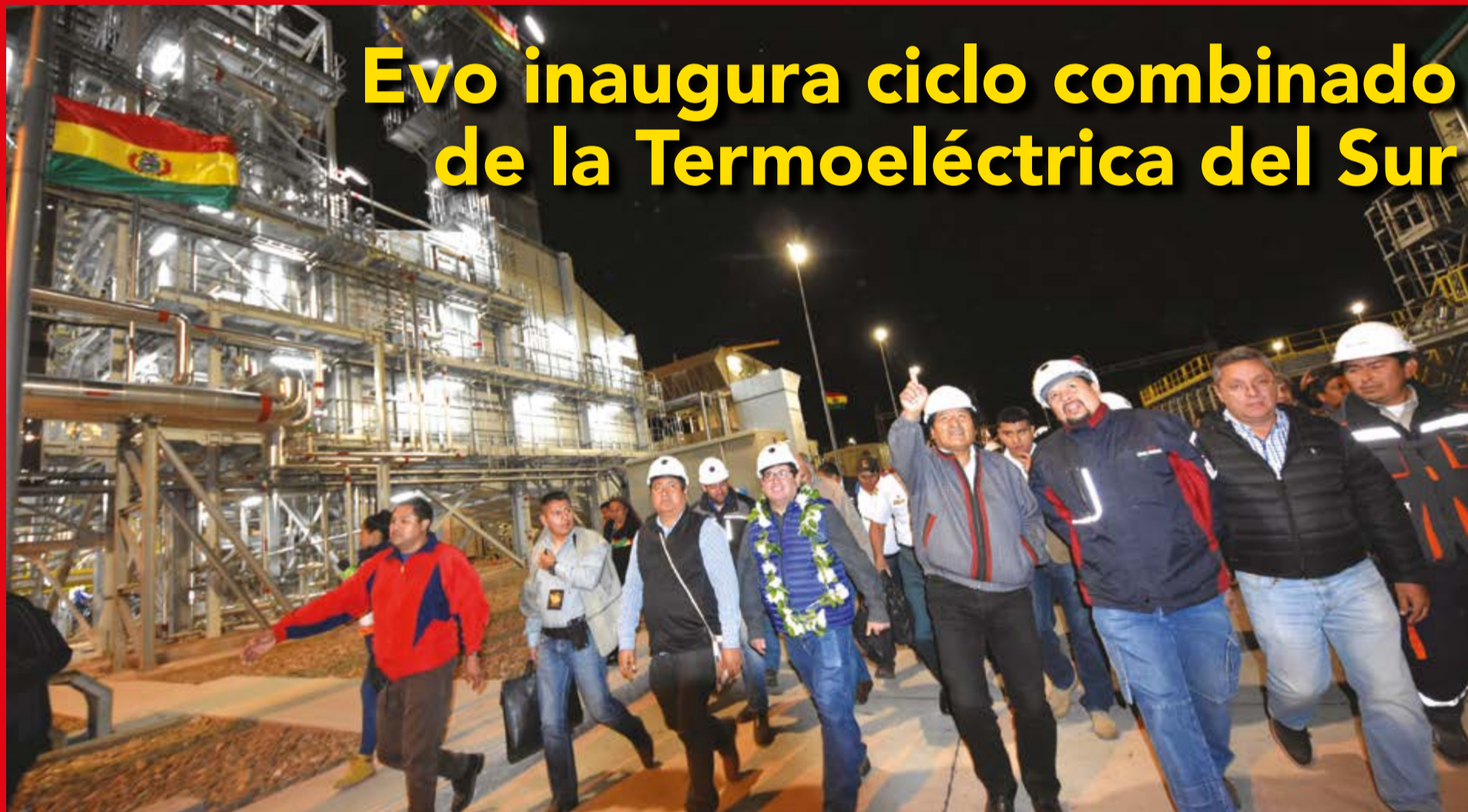
La planta, ubicada en el municipio de Yacuiba, departamento de Tarija, incrementará la generación de energía a 480 MW.

Municipio de La Guardia se beneficia con módulo educativo de secundaria