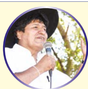
Evo Morales Ayma Presidente del Estado

En el marco de un manejo responsable y prudente, la administración económica del Estado Plurinacional lleva adelante una política salarial que ha mejorado el poder adquisitivo de los salarios, contribuyendo al dinamismo de la demanda interna, motor del crecimiento económico en el Modelo Económico Social Comunitario Productivo (MESCP).